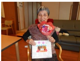
人生いつも初体験! 97歳 75歳 楽しんでいきましょう(^o^)